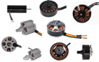
Drohnen4.jpg: Diverse Flugmotoren für Drohnen